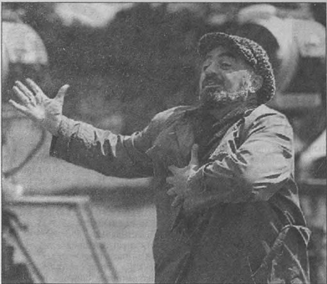
Поведение Параджанова на киносъемках — неповторимы и забавный театр.

На деле Горбачев делал себе карьеру, или, как сейчас принято говорить, заботился о своем рейтинге и дома, и за рубежом.