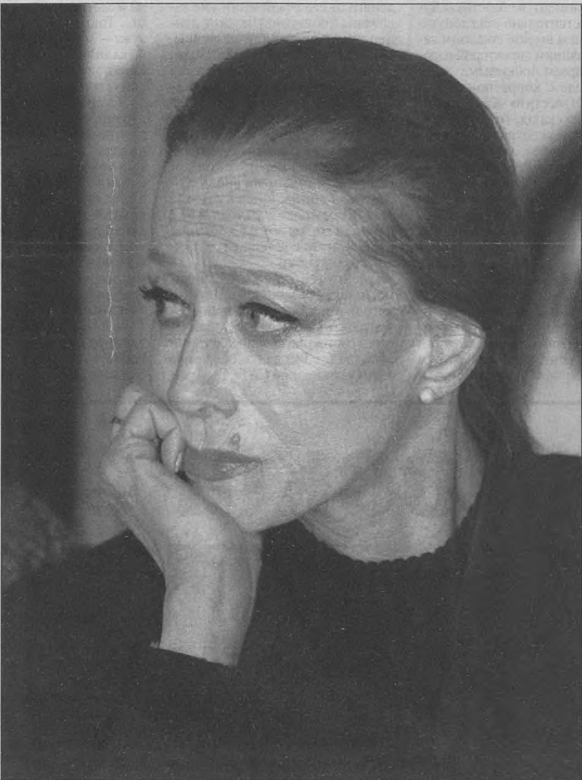
Сергей Параджанов не только мечтал, чтобы Плисецкая сыграла главную роль в фильме «Демон», но и подготовил эскизы для ее костюмов.

— Не предполагаете, что у таких Мастеров, как Параджанов, имелась некая