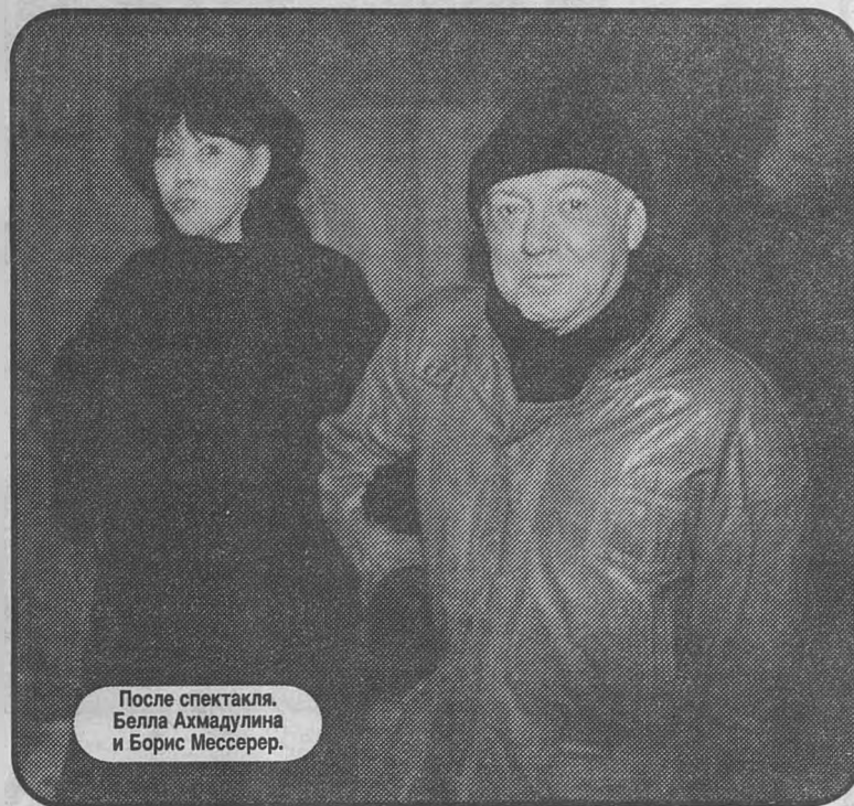
После спектакля. Белла Ахмадулина и Борис Мессерер.