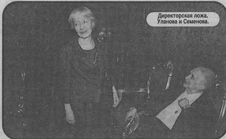
Директорская ложа. Уланова и Семенова.