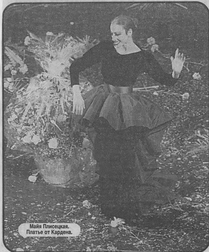
Майя Плисецкая. Платье от Кардена.