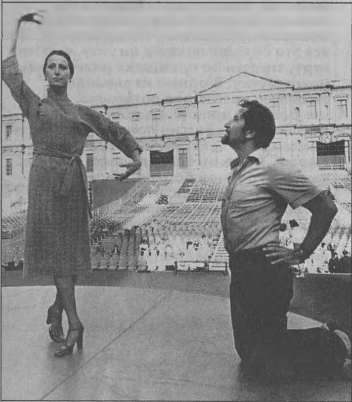
Перед ней мы все на коленях. Морис Бежар не исключение

Основная линия оперы, как я это понимаю, — графиня и Сен-Жермен. Графиня всю жизнь ждет второй встречи с Сен-Жерменом, человеком фантастического магнетизма, от которого женщины сходили с ума. И наконец дожидается. Ради встречи графиня наряжается в свой лучший наряд, роскошные перья... Она не дряхлая старуха, она — самая красивая женщина 18-го столетия. В 20-м столетии такой женщиной я вижу только Майю Плисецкую. Я передал Майе Михайловне письмо, где, как мог, изложил суть идеи. В следующий ее приезд в Москву мы встретились. Разговор длился три часа. Майя очень заинтересовалась, но вдруг спросила: «Ну, понятно, а кто петь-то будет?» — «Как кто? Вы!» И тут она расхохоталась, расхохоталась, как ребенок... Но мне нужен был именно ее выразительный густой голос.