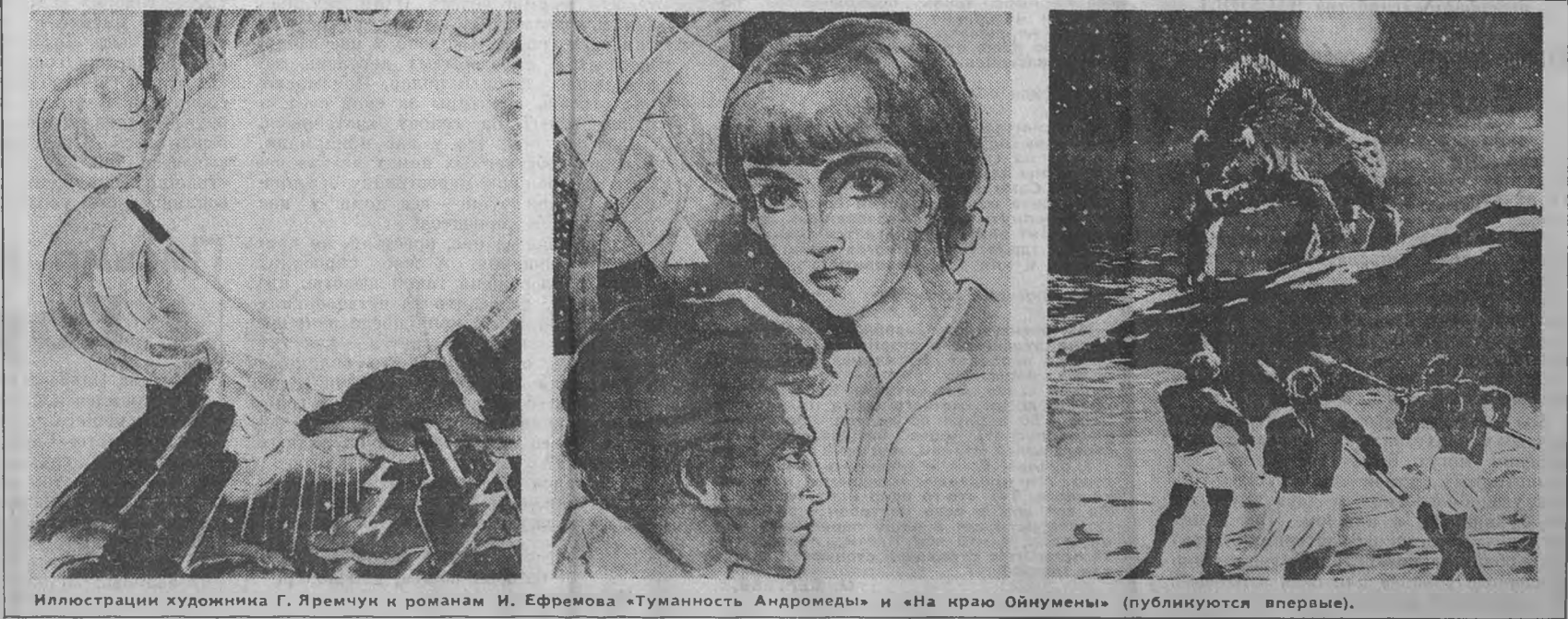
Иллюстрации художника Г. Яремчук к романам И. Ефремова «Туманность Андромеды» и «На краю Ойкумены» (публикуются впервые).