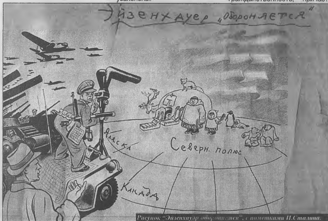
Рисунок "Эйзенхауэр обороняется", с пометками И. Сталина.

Слава Богу, и сейчас, в "минуты роковые", люди не теряют чувства юмора, иронизируют над сложностями жизни, смеются над неустройствами и нелепостями быта, сохраняют способность сатирически взглянуть на события подчас совсем не веселые. Относитесь с юмором к себе и к окружающему миру, смейтесь почаще, если хотите прожить долго!