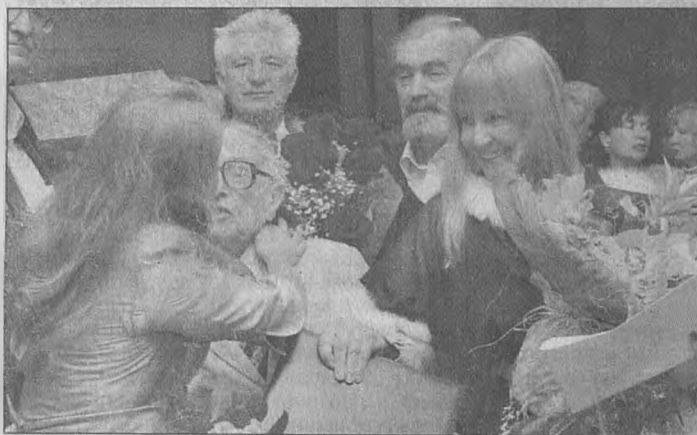
Чествование Бориса Ефимова прошло в Российской академии художеств. С цветами и поцелуями...