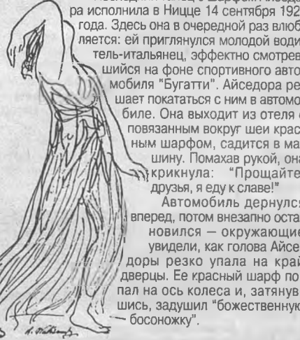
Последний танец с шарфом Айседора исполнила в Ницце 14 сентября 1927 года. Здесь она в очередной раз влюбляется: ей пригласился молодой водителем-итальянец, эффектно смотревшийся на фоне спортивного автомобиля "Бугатти". Айседора решает покатайся с ним в автомобиле. Она выходит из отеля с повязанным вокруг шеи красным шарфом, садится в машину. Помахав рукой, она крикнула: "Прошайте, друзья, я еду к славе!" Автомобиль дернулся вперед, потом внезапно остановился — окружающие увидели, как голова Айседоры резко упала на край двери. Ее красный шарф попал на ось колеса и, заткнувшись, задушил "божественную босоножку".

Те, кто видел танец Айседоры, надолго сохранили о нем память. Хулигана Есенина он также не оставил равнодушным, особенно тот странный танец с шарфом, который она исполняла перед поэтом. "Держит она шарф за хвост, а сама в пляс. И кажется, не шарф — а хулиган у нее в руках... Хулиган ее и обнимает, и треплет, и душист... А потом вдруг — раз! — и шарф у ней под ногами. Сорвала она его, распотопала — и кришка! Нет хулигана, смятая тряпка на полу валяется... Сердце сжимается. Точно это я у нее под ногами лежу. Точно это мне кришка".