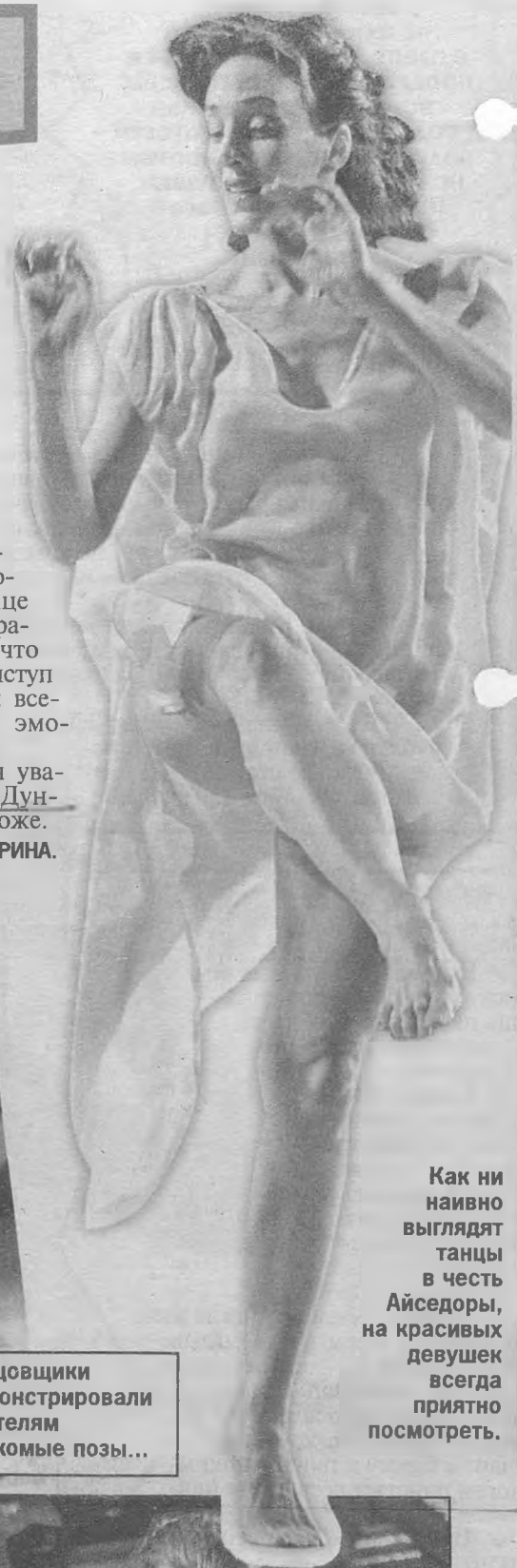
Как ни наивно выглядят танцы в честь Айседоры, на красивых девушек всегда приятно посмотреть.