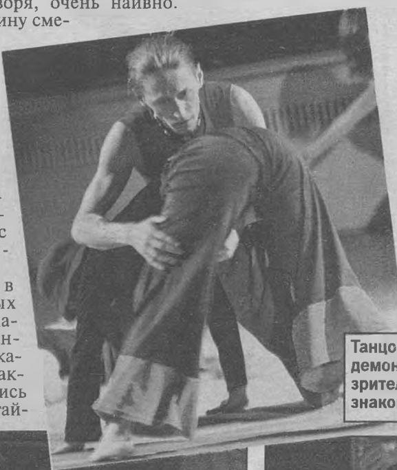
Танцовщики демонстрировали зрителям знакомые позы...