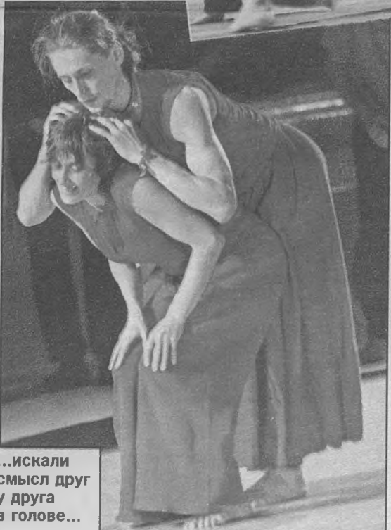
...искали смысл друг у друга в голове...