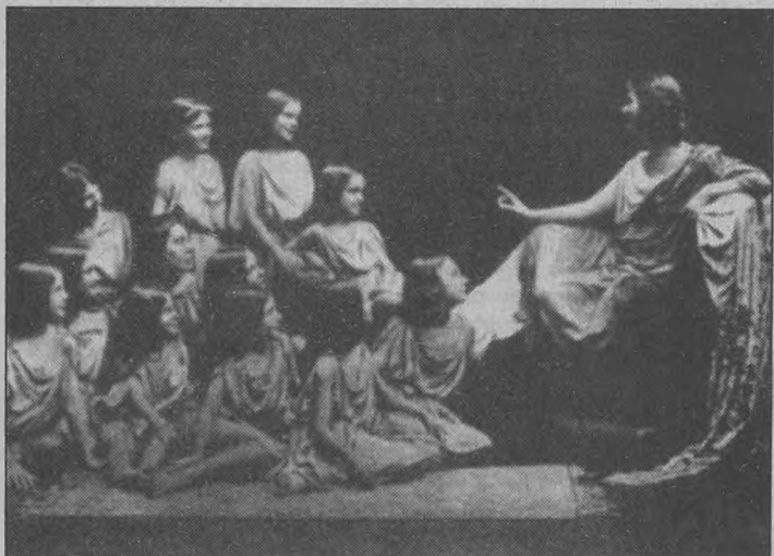
Айседора Дункан со своими учениками.