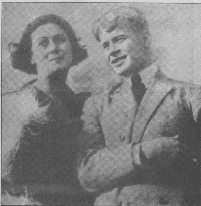
Айседора Дункан и Сергей Есенин.

Так вот, те, кто жаждет отведать именно этой любовной истории, тщетно будет искать хотя бы следы великого русского поэта в книге «Моя жизнь» (издательство «Центрполиграф», 2005), биографическом произведении, написанном Айседорой Дункан. Повествование заканчивается в предчувствии любви, обновления, встречи с Россией. Обвеваемая