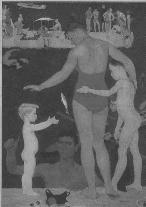
Семья. У моря. 1964 г.

Жилинский именно что титан, мэтр из мэтров советской живописи. Советской — в смысле эпохи, а не идейной направленности: от художника, у которого были расстреляны дед и отец, можно ждать формальной лояльности, но не пропагандистского рвения. Академик и лауреат, профессор Суриковки и Полиграфического института, в неофициальной классификации он всегда относился к стану не то чтобы «левых», но «приличных» живописцев. Речь даже не о социальном поведении, а о творчестве. Для случайного зрителя понять, чем Жилинский лучше Глазунова или Шишова, не так просто, однако если и существуют у нас истинные продолжатели традиций итальянского и Северного Возрождения, то нынешнего юбиляра можно назвать первым. Боттичелли, Беллини, Крахан, Дюрер для него не образцы, но примеры. Иногда Жилинского несправедливо причисляют к создателям «сурового стиля». Его собственное мнение отражает объективную реальность: «Я никогда