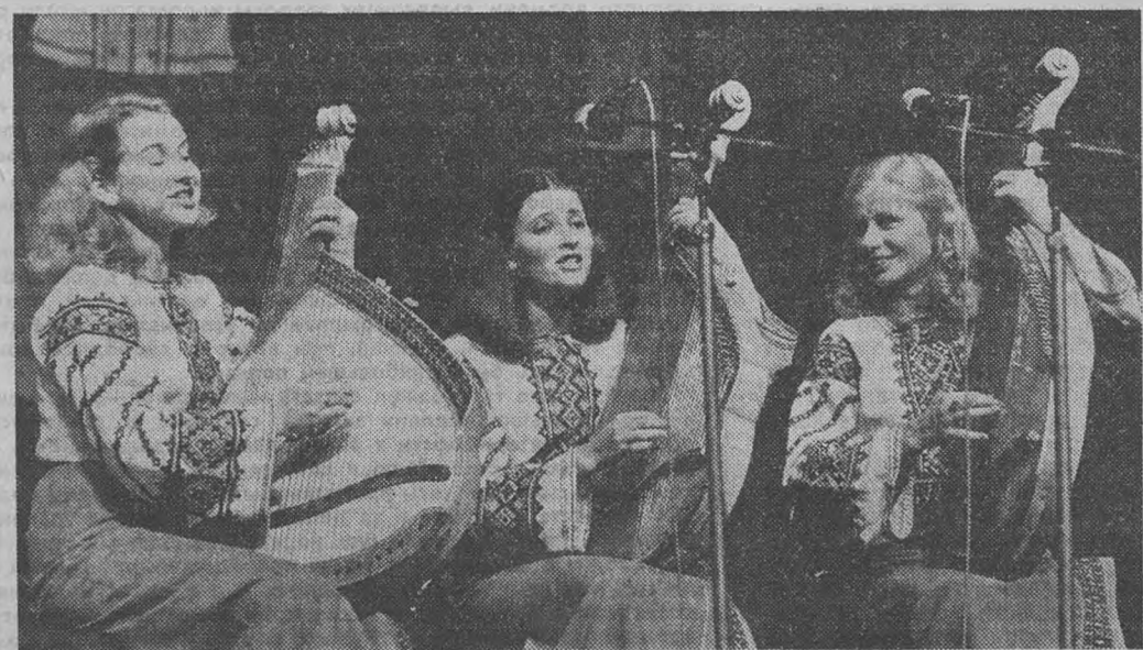
С большим успехом прошли в ФРГ выступления трио бандуристок Львовской государственной консерватории.