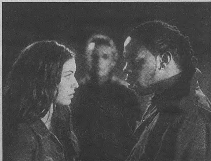
«Хэллоуин: Воскрешение»: истина где-то рядом. С ножом