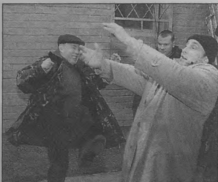
■ Владимир Гостюхин (слева), несмотря на усталость, дерется лихо

– Тяжело, конечно, очень, – говорит актер. – Снимаем шесть дней в неделю по двенадцать, а то и больше часов в сутки. И текста много, и по эмоциям роль сложная, да еще драки всякие, физические нагрузки... Специально для этих