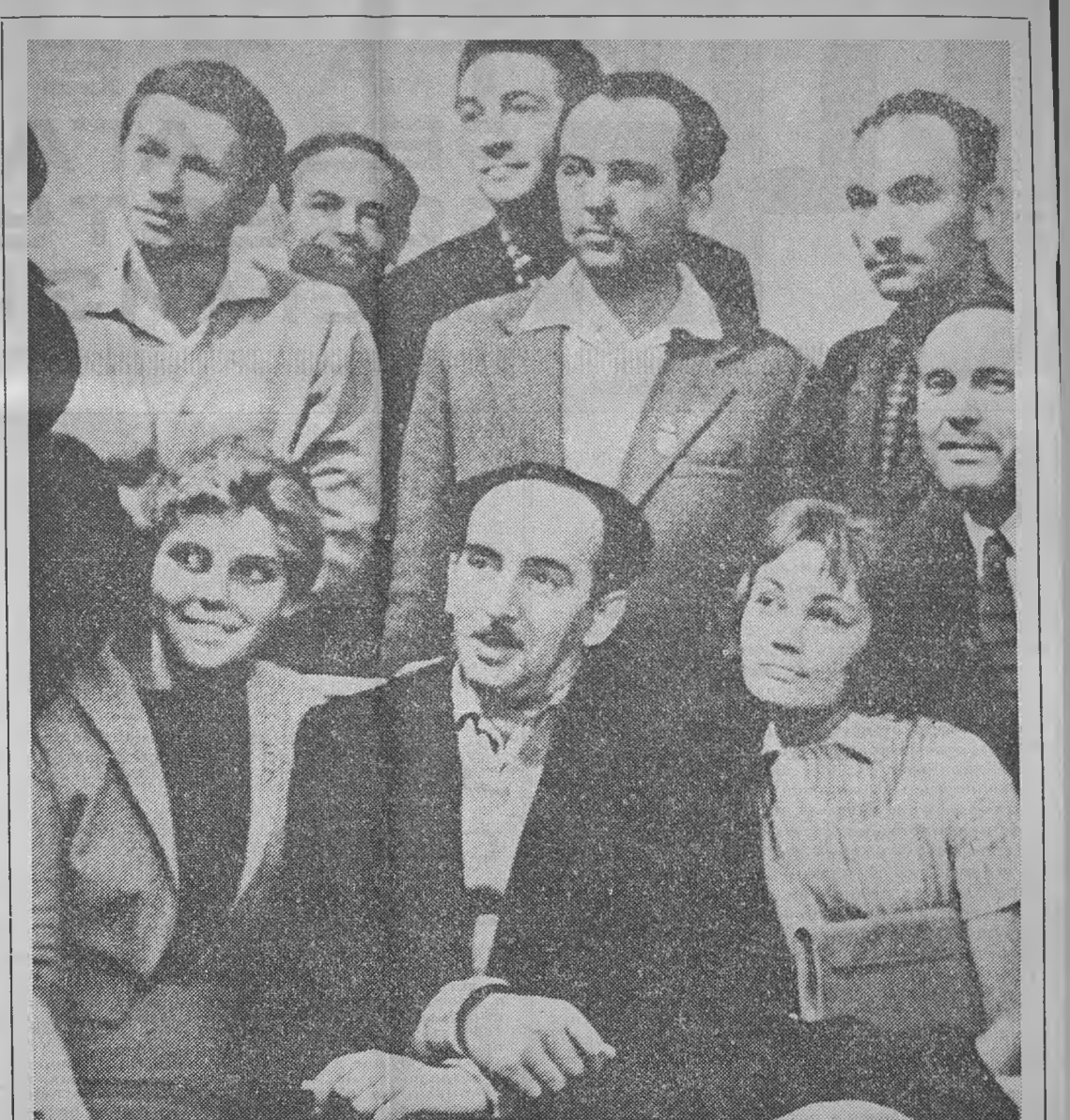
В сентябре 1961 года в Ростове шли съемки фильма «На семи ветрах» по сценарию Александра Галича. Тогда же был сделан и этот снимок, где А. Галич зачитывает с молодыми тогда актерами В. Тихоновым, Л. Быковым и другими известными сегодня артистами театра и кино.

Вот как на деле выглядел период «равновесия» двух муз: с одной стороны, песня в «Комсомольской правде» под названием «Руку дай, молодость моя», с другой — «Спрашивайте, мальчики, спрашивайте», с одной — песенки из сценария «Добрый город» в «Неделе», с другой — «Старый вальс», с одной — песенка «Дождем в той же «Неделе», с другой — «Облака плывут, облака», с одной — стих в «Сельской молодежи» «Дорогой мой человек» и «Добрый вечер» в «Крестьянке», с другой — «Товарищ Парамонов» и «Право на отдых» и т. д. и т. п. Уж очень это походит на аналогичную ситуацию, возникшую в творчестве другого литератора примерно в это же самое время: он однове-