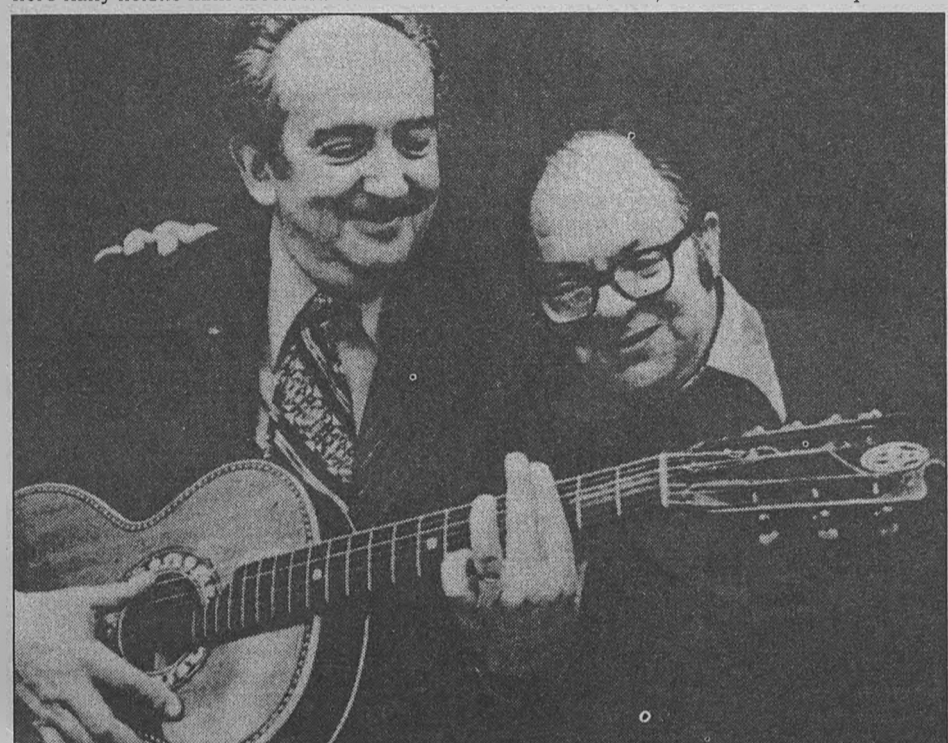
С Наумом Коржавиным в США.

вдруг он говорит: «Оставь черные туфли. Плохая примета. Потом возьми». Актеры вообще очень суеверны — он ведь начинал как актер — роль уронил, значит, обязательно должен сесть, гвоздь на сцене нашел — надо засунуть его в сумку, черное дарить на Новый год нельзя... Но мне же на спектакль! И я забрала туфли. А через несколько дней, 29 декабря 1970 года, состоялось правление Союза писателей, исключившее Александра Галича из своих рядов. Многие тогда ему звонили и говорили: «Напиши письмо, напиши письмо, ну что тебе, трудно — мол, ты понимаешь, мол, больше не будешь». Конечно, он не написал ничего. Зато появилось открытое письмо Союза писателей Союзу кинематографистов, и в результате из последнего папу исключили автоматически.