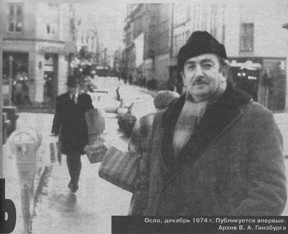
Осло, декабрь 1974 г. Публикуется впервые.

Вспомните тех, кого у нас исключали из Союза писателей: Зощенко, Ахматову, Пастернака, Солженицына. Александр Галич в их числе! В этом списке только двое живых. И память