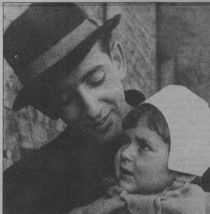
Александр Галич в своем московском дворе за несколько дней до отъезда. Фотография публикуется впервые.

- Я беседовала с его французскими коллегами. «Вы знаете, Алена, - говорили они, - у Саши все так прекрасно складывалось в Париже: замечательная кварти-