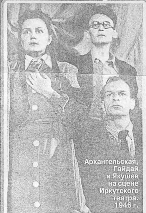
Архангельская, Гайдай и Якушев на сцене Иркутского театра. 1946 г.