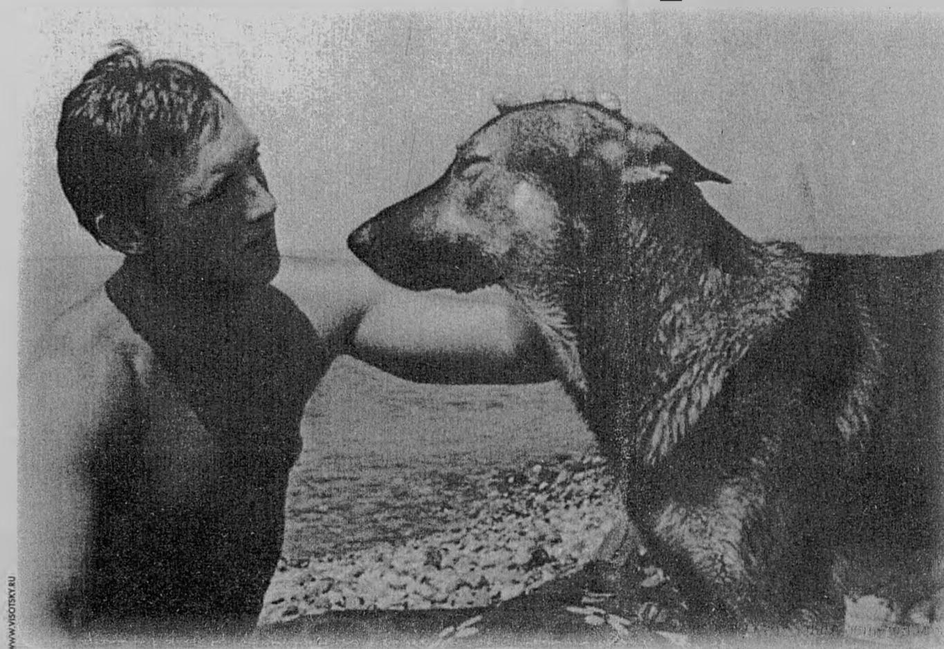
Пицунда. 1973 г.

Есть много чих-то воспоминаний и рассуждений о последнем годе его жизни. Он был действительно тяжелым. Все сошлось: кризис личный и