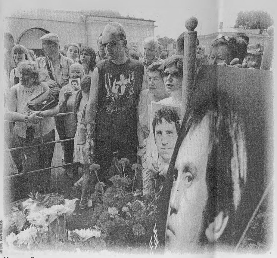
Москва. Ваганьковское кладбище. 25 июля 2005 г.