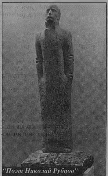
"Поэт Николай Рубцов"

Ищущим хочу напомнить: Леонардо избрал летательный аппарат, Микеланджело писал сонеты, Бенвенуто Челлини написал книгу. Пишущим историю искусств никогда не приходило