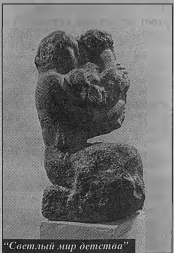
"Светлый мир детства"

рее – привычка скрупулезно собирать только достоверные факты, привычка, выработанная во время долгого изучения знаменитого шедевра.