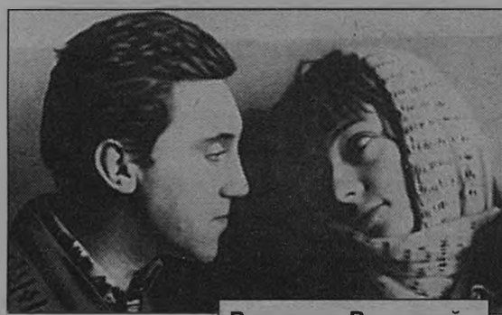
Владимир Высоцкий и Людмила Абрамова.

Двадцать лет назад умер Владимир Высоцкий. На похороны поэта и актера вышла вся страна