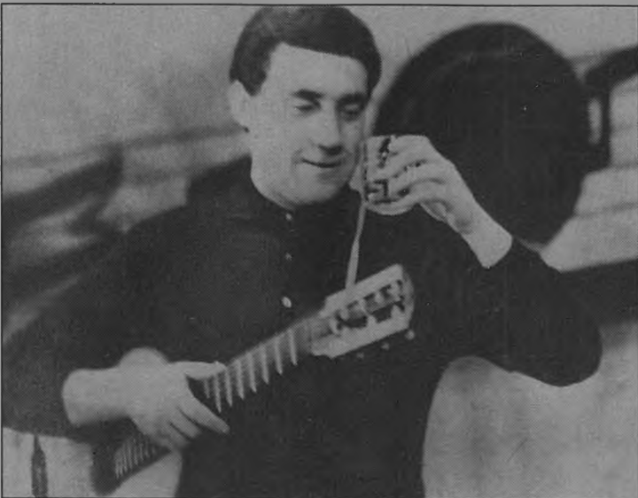
Выступление в Ленинграде. 1967. Фотография публикуется впервые.