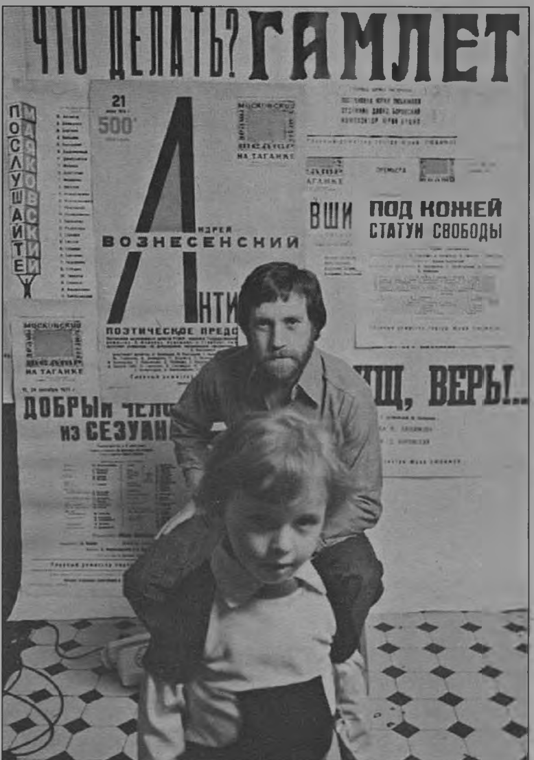
У него не было сил радоваться жизни