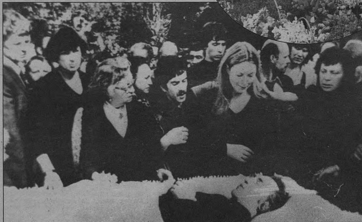
Хоронили Высоцкого «при огромном стечении народа»