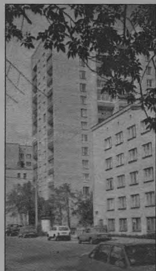
В доме на Малой Грузинской актер жил последние годы