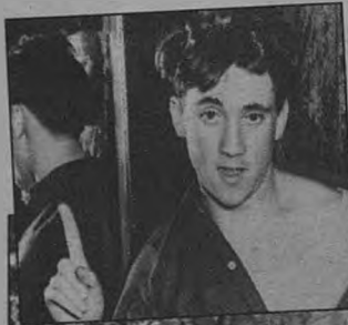
«Где мне семнадцать лет? На Большом Каретном...»

Здесь Владимир жил у отца с мачехой с 1949 по 1955 год. Родители к тому времени развелись и решили, что Володе лучше жить под мужским присмотром. Так что в пятый класс Высоцкий пошел в мужскую школу № 186, которая находилась на этой улице в доме № 22, стр. 6 (сейчас это школа № 1276). Одноклассники тут же придумали Высоцкому кличку Американец — из-за заграничных костюмов, в которых ходил Володя (до этого он несколько лет прожил с отцом в Германии). Позже у него появилась другая кличка — Высота. А совсем рядом, в Первом Колобовском переулке, дом № 12, до сих пор работает Московский винный завод, куда юный Высоцкий бегал с друзьями за вином. Ведь не секрет, что употреблять спиртное он начал очень рано. Сегодня дом, где провел юность Владимир Семенович, украшают аж три мемориальные доски, которые указывают, что здесь жил знаменитый артист.