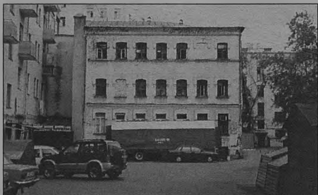
В этом доме была коммуналка, где прошло детство Высоцкого

Великого артиста и поэта не стало 25 июля 1980 года. Всю свою недолгую жизнь он прожил в столице. «Антенна» проводит экскурсию по Москве Владимира Высоцкого.