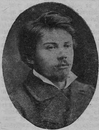
У. И. Авранек в молодости.

В течение более полвека У. И. Авранек был главным хормейстером и одним из дирижеров Московского Большого театра.