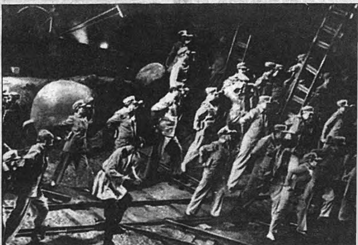
Сцены из спектакля "Семен Котко"