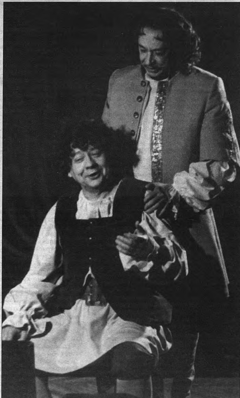
О.Ефремов и О.Табачков в спектакле "Кабала святош"