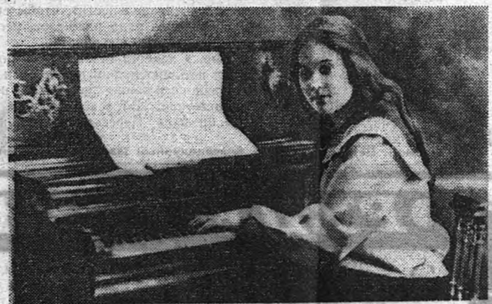
Любовь ОРЛОВА в детстве.

актриса. — Например, я получила очень дорогое кольцо, цену его даже трудно определить... — И Орлова поведала журналистам историю подарка.