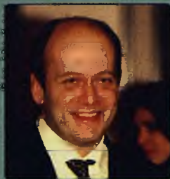
Денис Евстигнеев, кинорежиссер