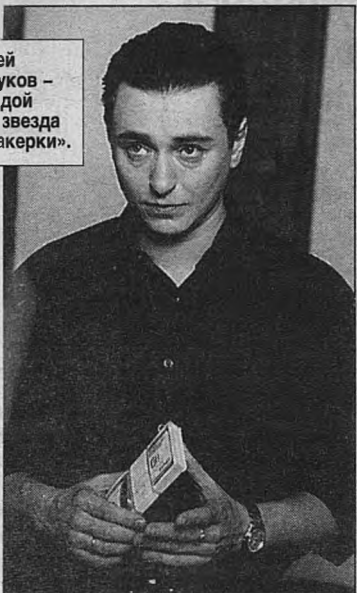
«Мент» - Константин Хабенский.