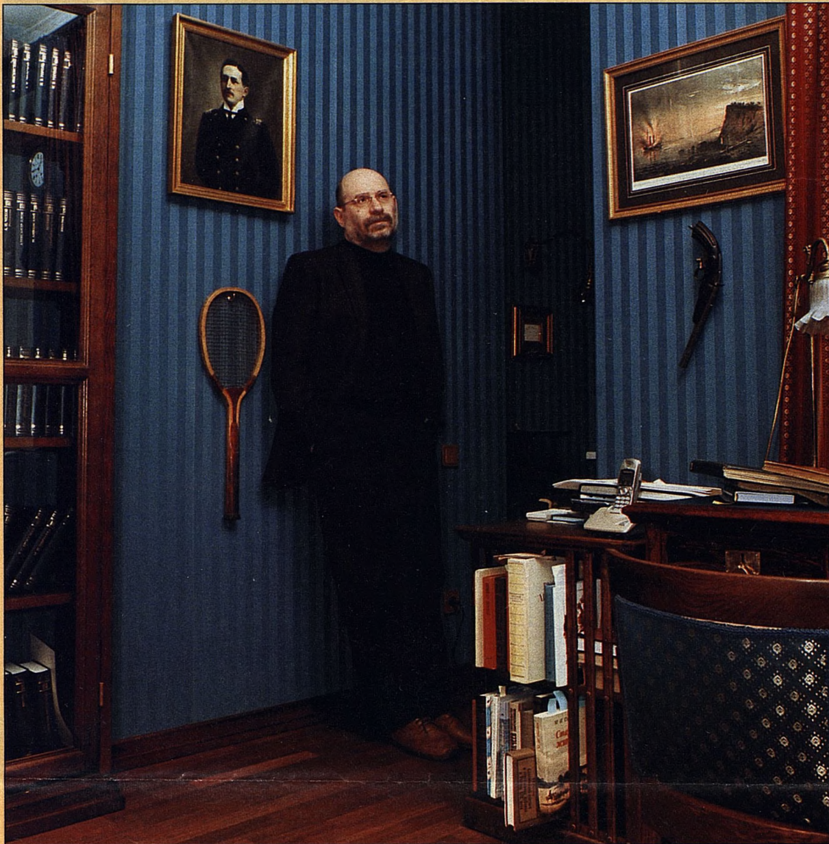
В кабинете писателя висит портрет Эраста Фандорина кисти неизвестного художника

— Сценарий фильма писали сами или в соавторстве с Адабашьяном?