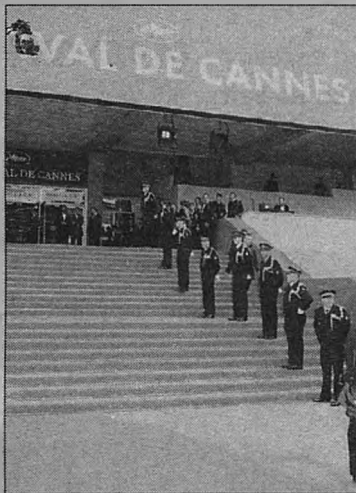
Та самая канская лестница