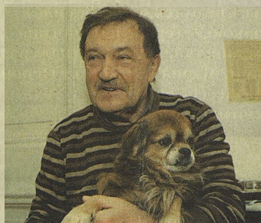
Пес Пушкин опытный путешественник — уже 15 раз пересекал Атлантику