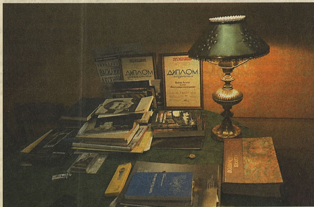
Букеровские дипломы Аксенов держит на столе

«Во дворе пылал куст, весь осыпанный огромными красными камелиями»