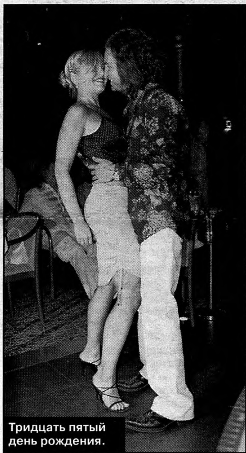
Тридцать пятый день рождения.